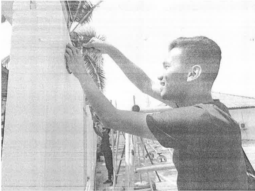
Gambar 5 : Aktiviti memasang lampu solar "Light to Bright"