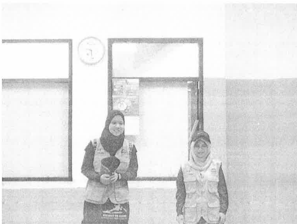
Gambar 2 : Mahasiswa USIM menerangkan aktiviti yang akan dijalankan