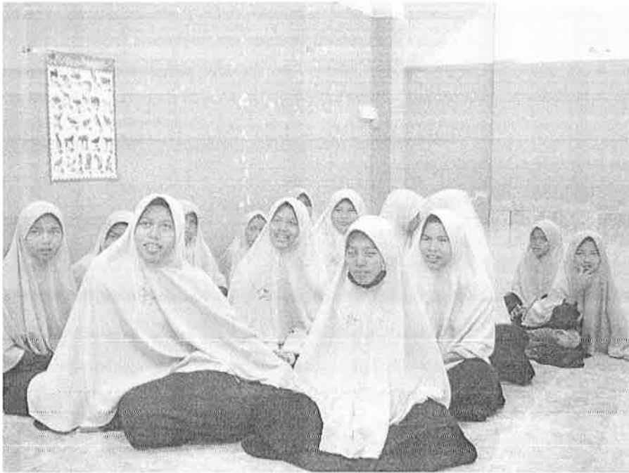
Gambar 1 :Anak yatim khusyuk mendengar tentang aktiviti yang akan dijalankan