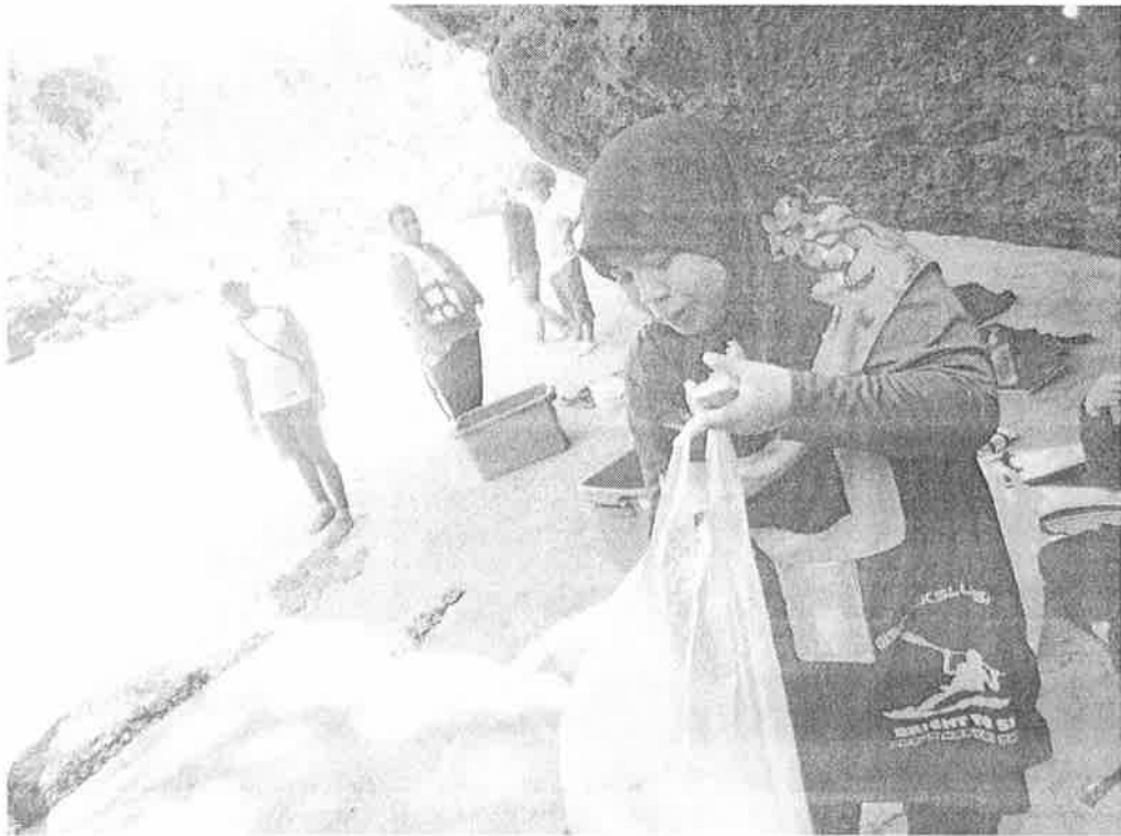
Gambar 8 : Mahasiswa membersihkan sampah sarap yang ada di tepi pantai