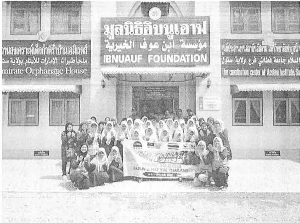
Gambar 7 : Foto kenangan sebelum meninggalkan rumah anak yatim