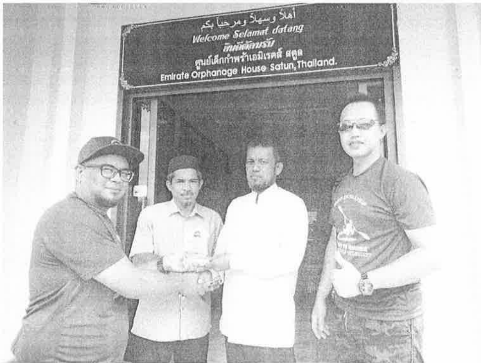
Gambar 6 : Sumbangan cenderahati daripada pihak USIM kepada Rumah Anak Yatim Emirates