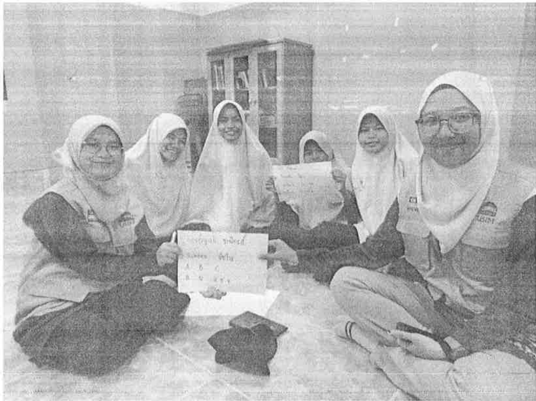
Gambar 3 : Aktiviti pemindahan ilmu antara peserta GISO dan anak yatim