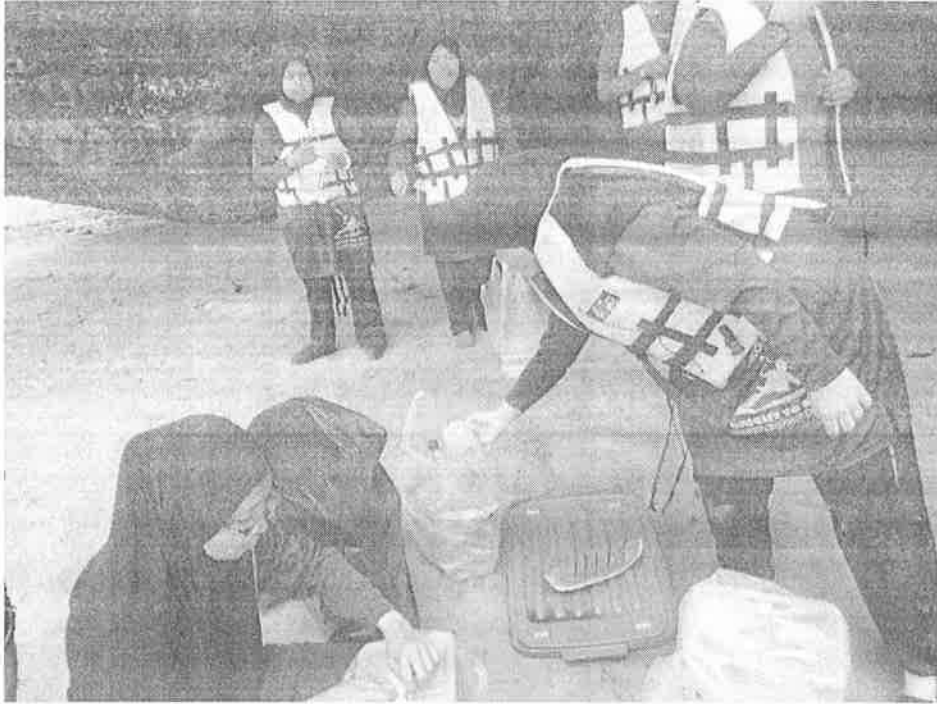
Gambar 10: Para peserta diberi taklimat tentang kepentingan menjaga alam sekitar di kawasan tarikan pelancong .