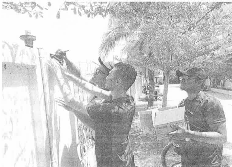
Gambar 4: Peserta GISO memasang lampu solar di sekitar Rumah Anak Yatim Emirates