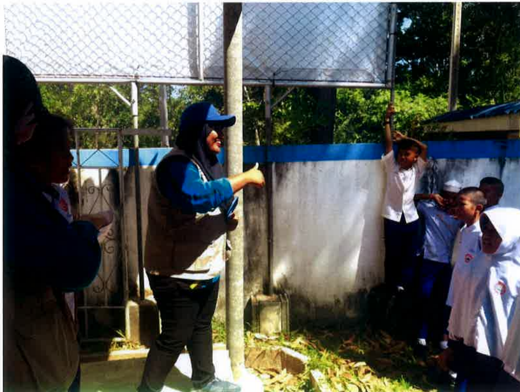
Checkpoint 3- Guess What Am I adalah aktiviti meneka gaya yang disampaikan oleh wakil kumpulan dengan menggunakan bahasa inggeris dan bahasa Thailand