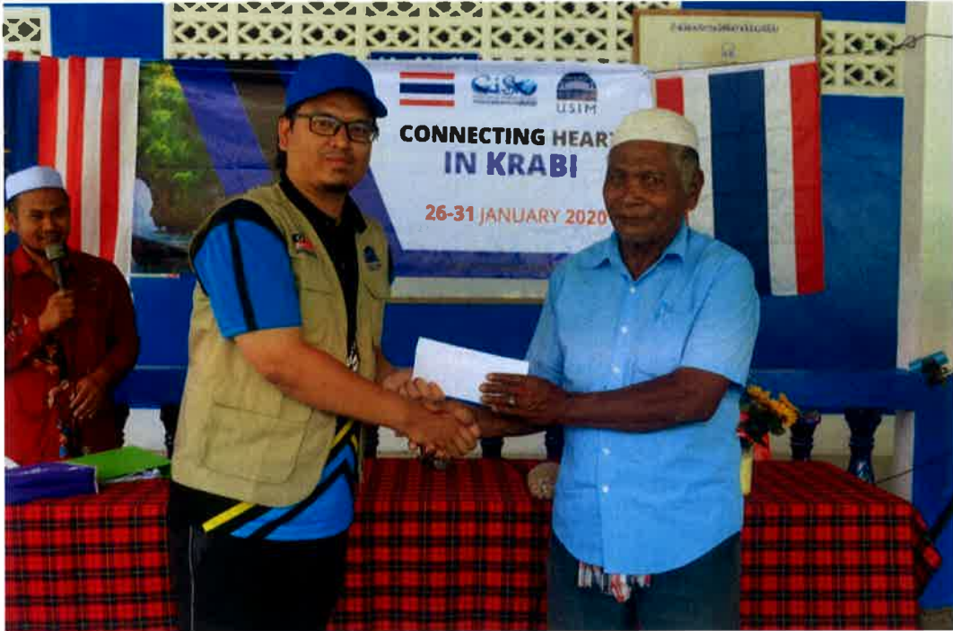
Penyampaian sumbangan berbentuk wang kepada ahli masjid.