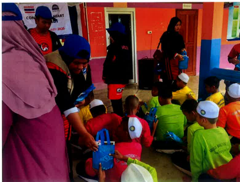
Penyampaian cenderahati berbentuk senaskhah yassin beserta makanan kepada semua pelajar yang menyertai aktiviti.