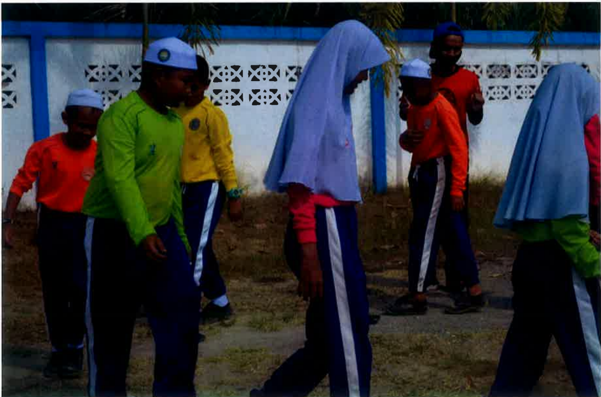
Aktiviti permainan music sandals secara berkumpulan.