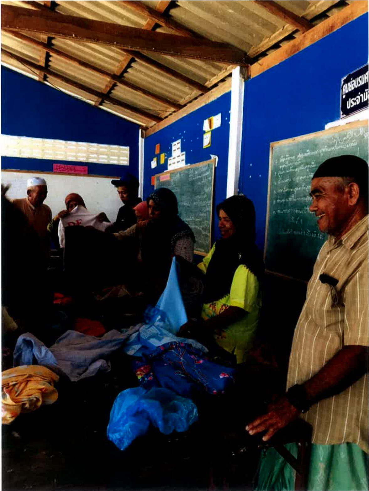
Aktiviti memilih pakaian sumbangan daripada ahli giso.