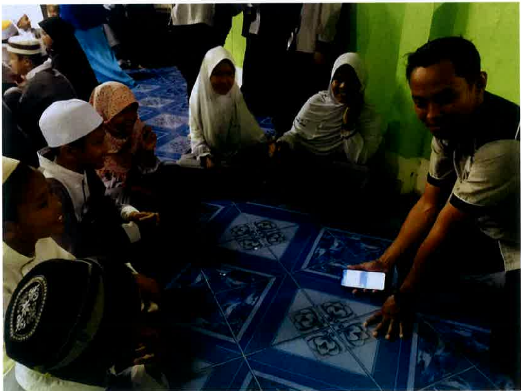
Sesi ice breaking dan cheers daripada fasi.