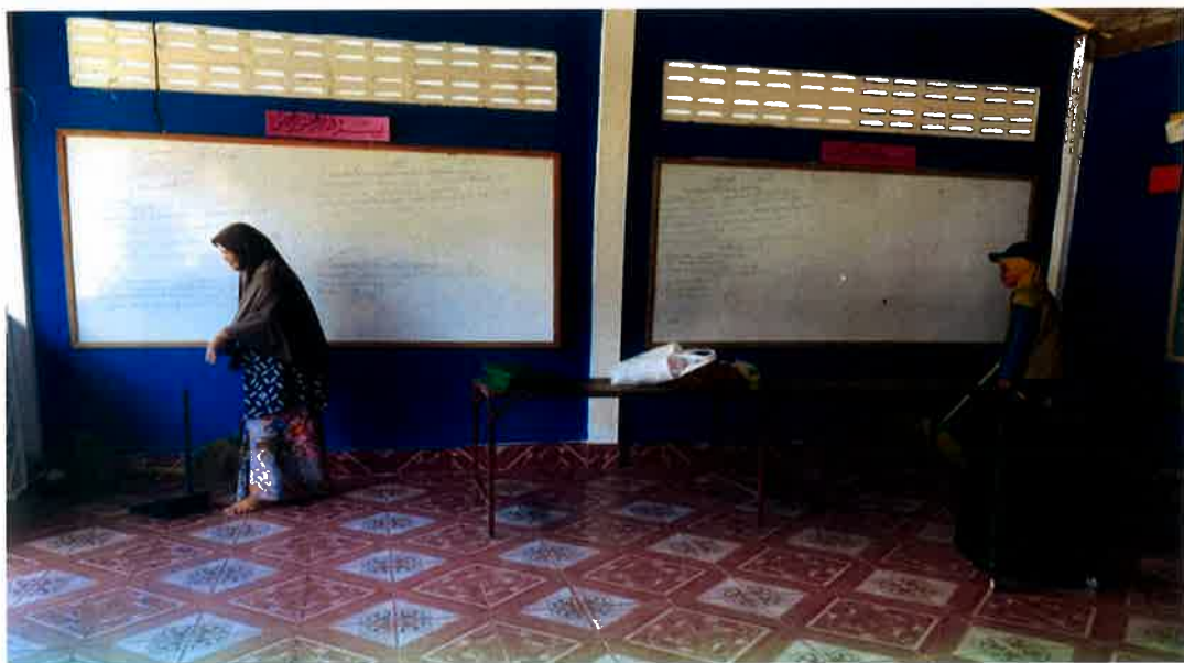
Aktiviti membersihkan kelas fardhu ain kanak-kanak di masjid.