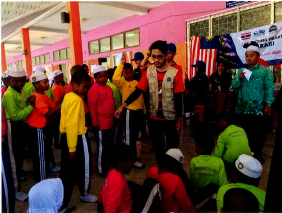
Sesi pembahagian kumpulan sebelum memulakan aktiviti sukaneka.