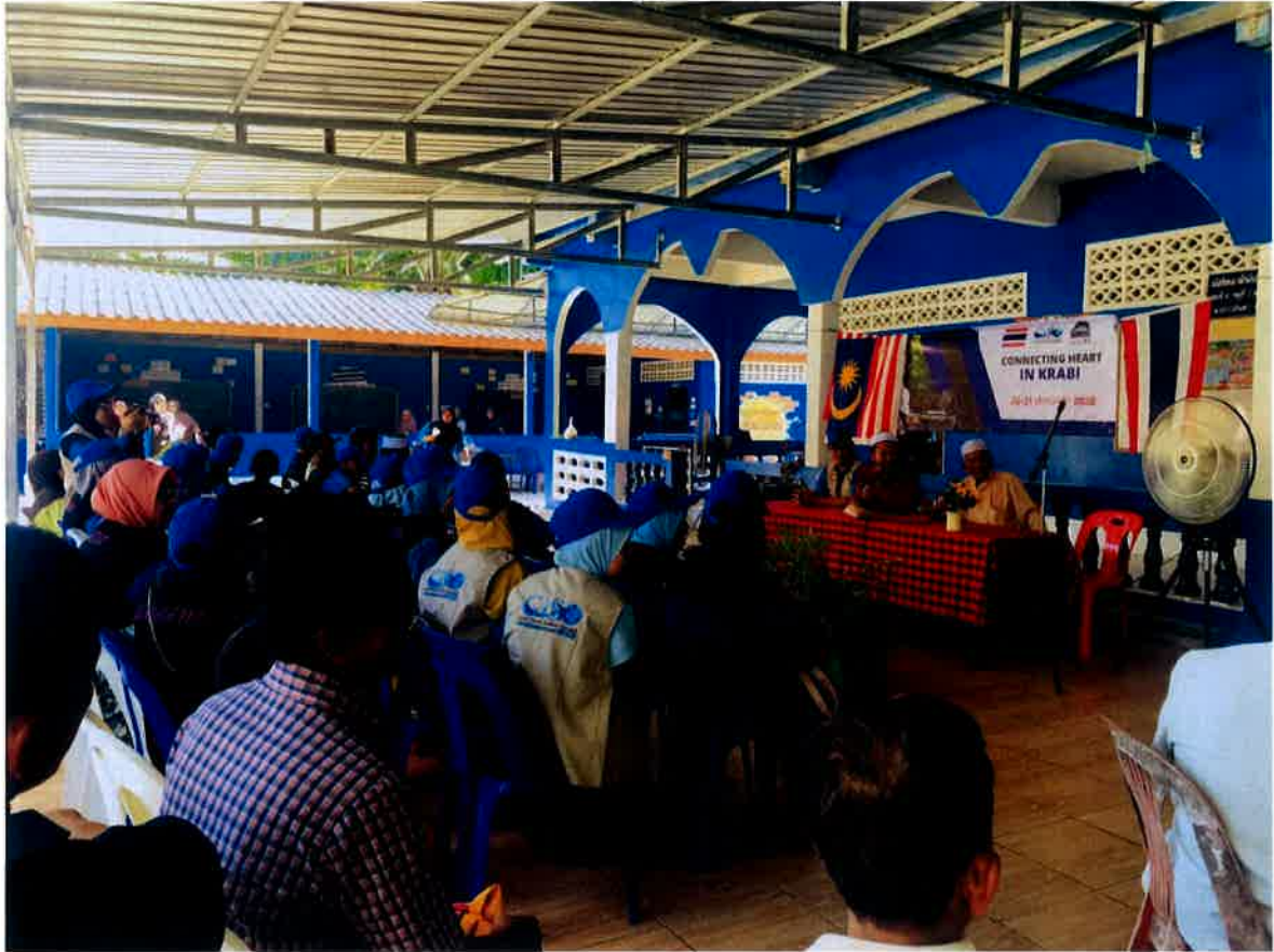
Sesi perkongsian dan ramah mesra bersama penduduk kampung.