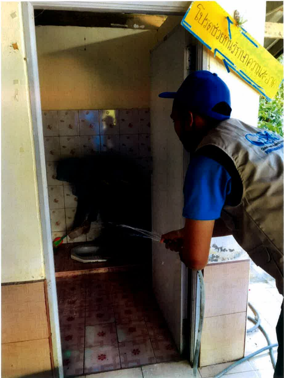
Ahli giso membantu membersihkan kawasan tandas masjid.