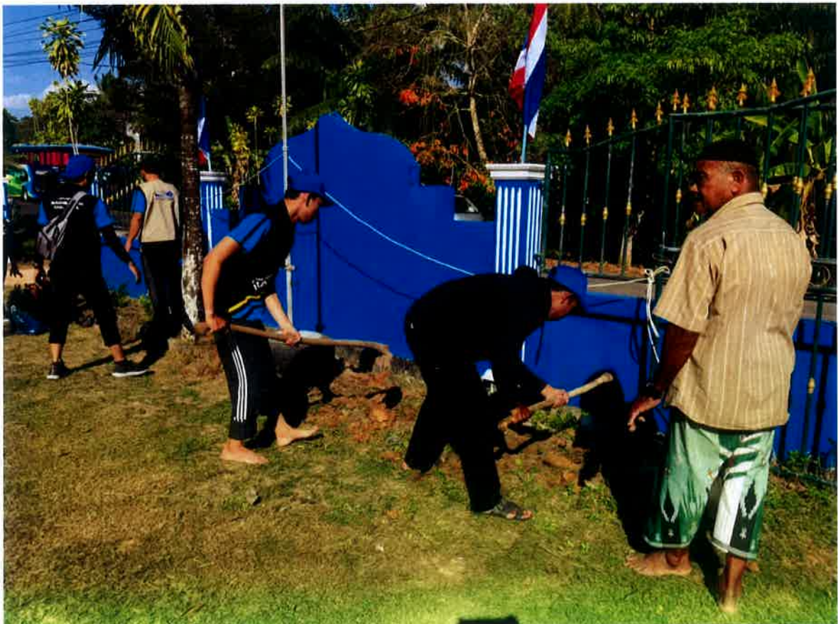
Aktiviti menanam pokok bersama penduduk kampung.