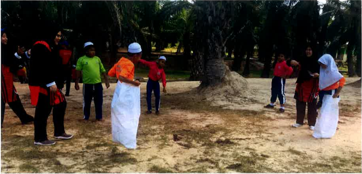
Permainan lari dalam guni oleh pelajar sekolah.