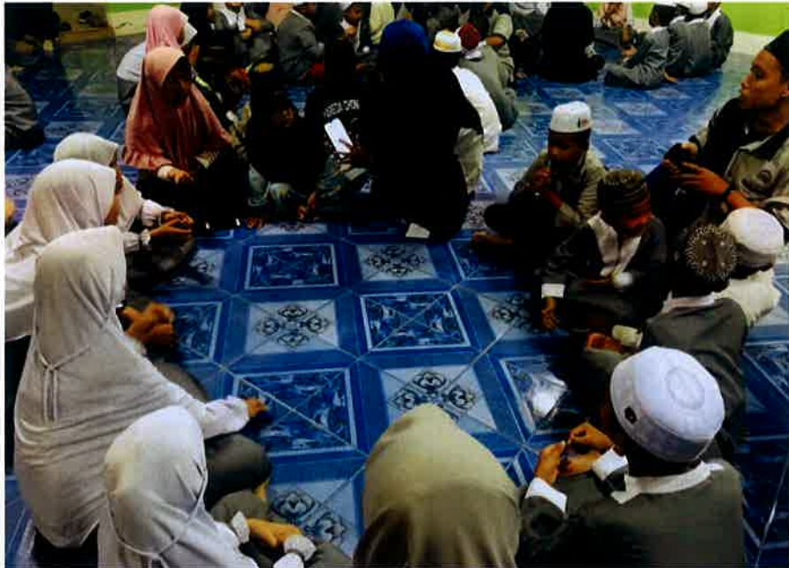
Fasi menerangkan arahan aktiviti kepada ahli kumpulan sebelum memulakan permainan.