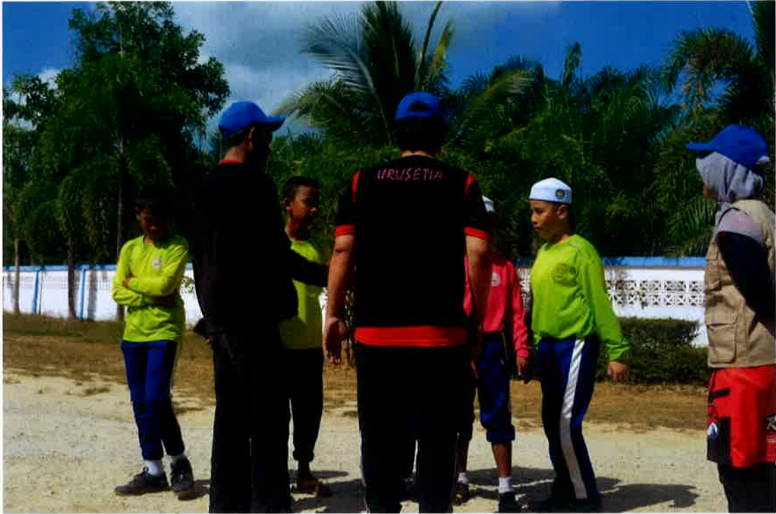
• Aktiviti menyanyi lagu bahasa Thailand bagi kumpulan yang kalah dalam permainan tuju selipar.