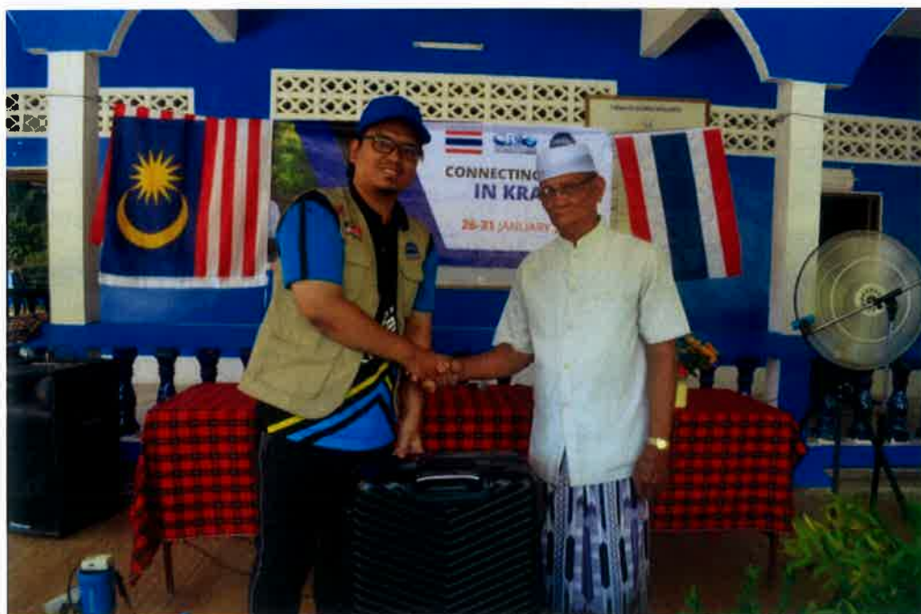
Perasmian sumbangan berbentuk pakaian daripada ahli giso.