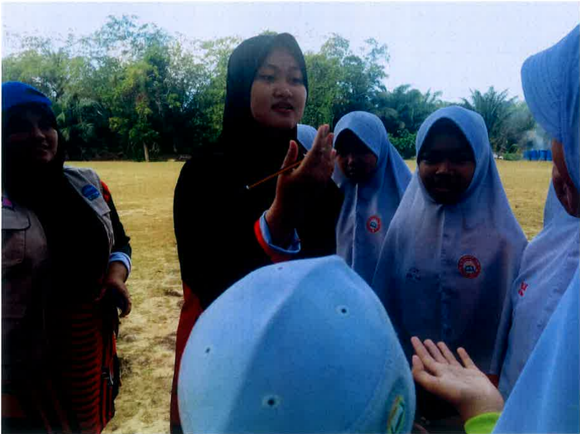
Sesi pembelajaran dan pertukaran Bahasa Melayu dan Thailand.