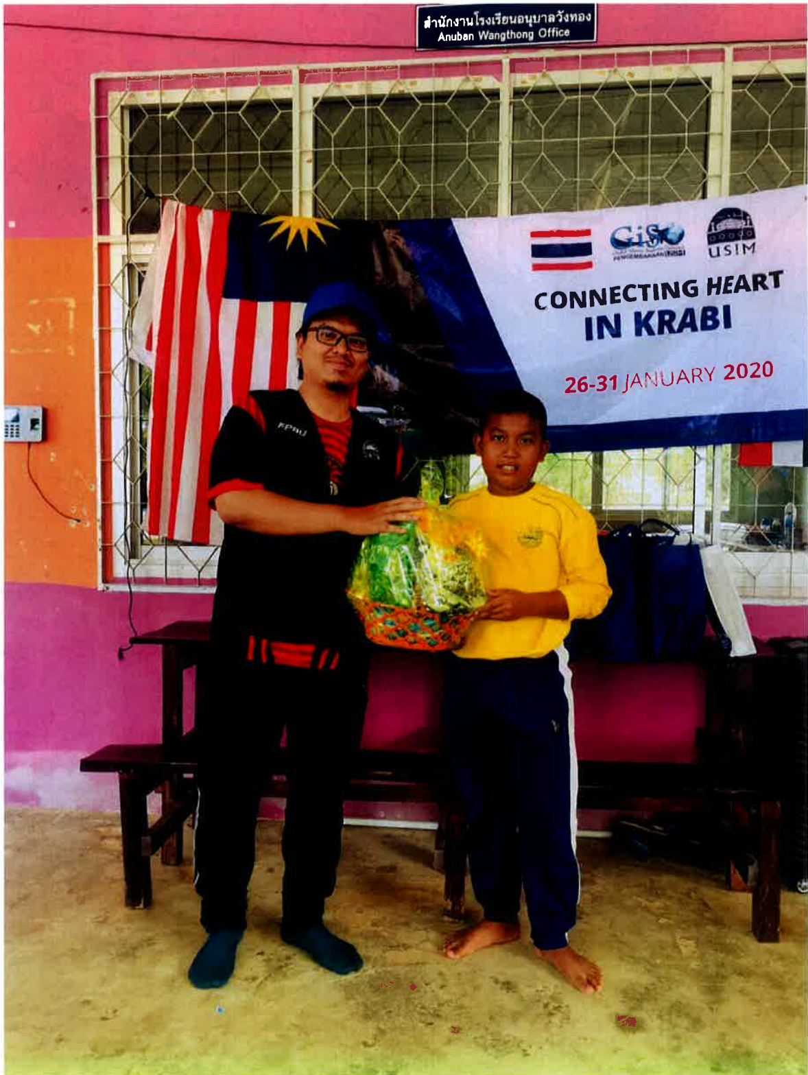
Penyampaian hadiah kepada wakil setiap kumpulan yang menang dalam keseluruhan aktiviti.