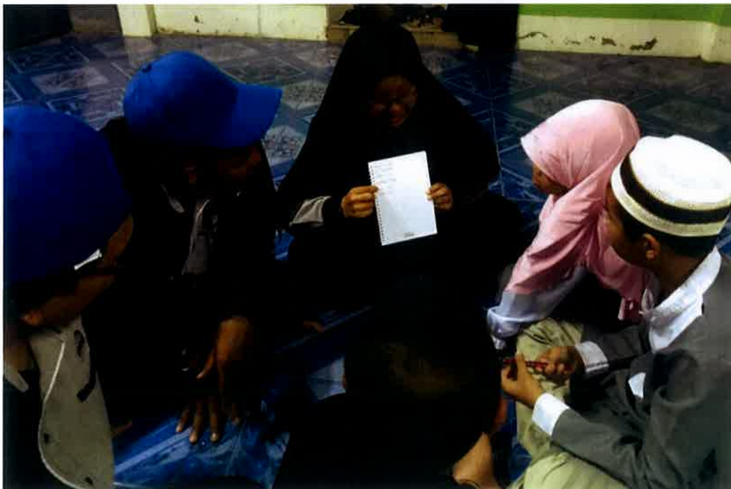
Aktiviti menyusun perkataan yang telah diterbalikkan menjadi perkataan yang betul dan tepat.