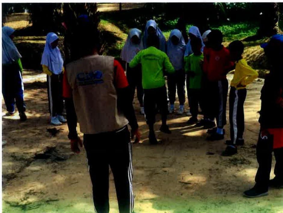
Permainan teng-teng yang dimainkan oleh pelajar sekolah.