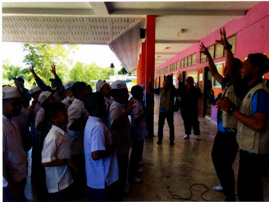
Sesi ice breaking bersama pelajar sebelum memulakan aktiviti explorace.