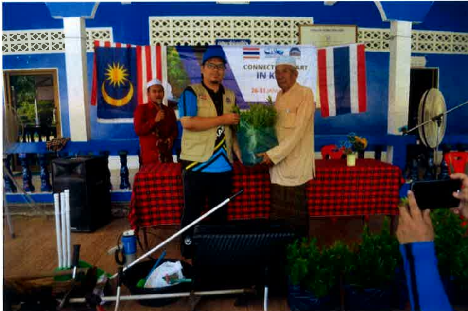
Perasmian menanam pokok di masjid.

Program berunsurkan libatsama masyarakat.