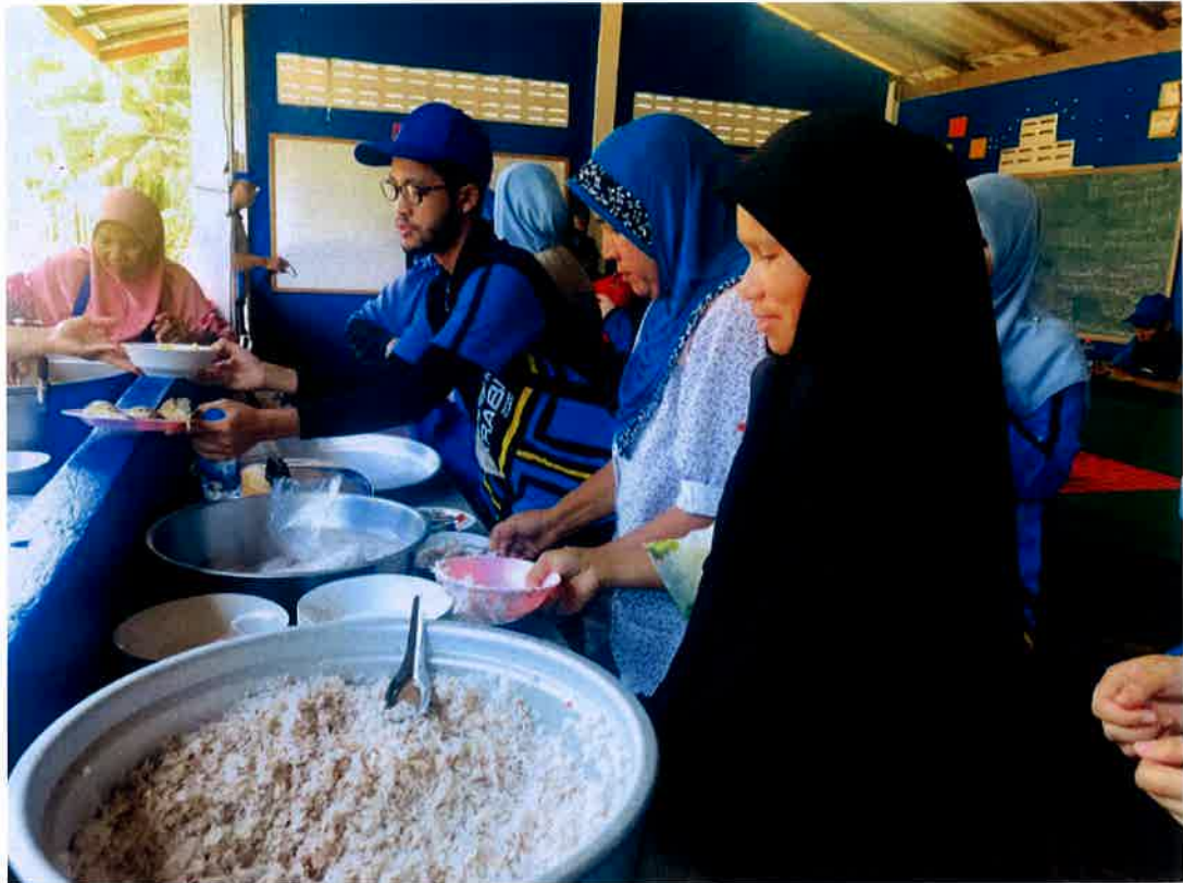
Aktiviti membantu penduduk kampung menyediakan makanan tengah hari.