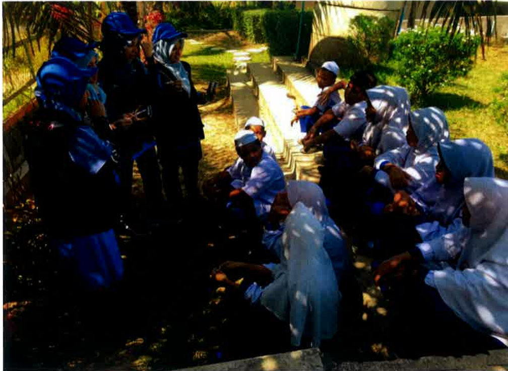
Checkpoint 2- Aktiviti Spelling Bee iaitu proses berfikir secara kritis untuk memastikan perkataan yang diberi dieja dengan betul dan tepat