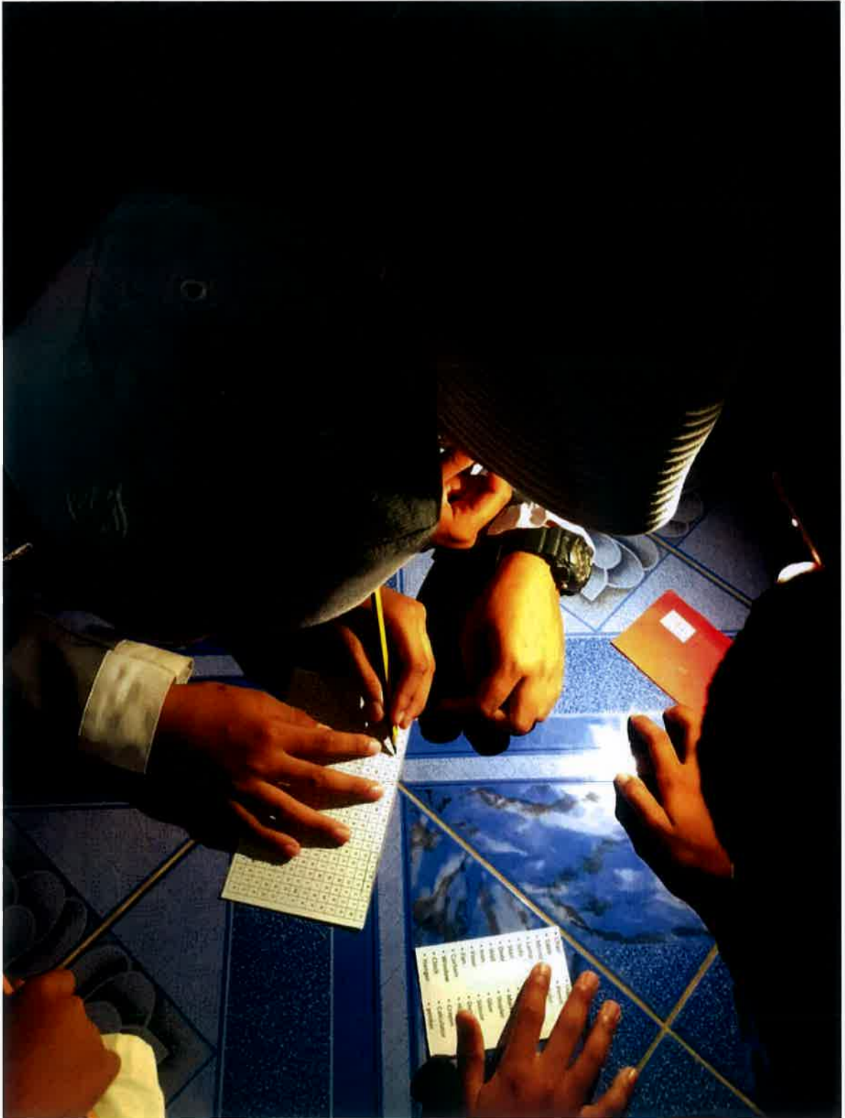
Aktiviti cross word oleh sekumpulan kanak-kanak asnaf.