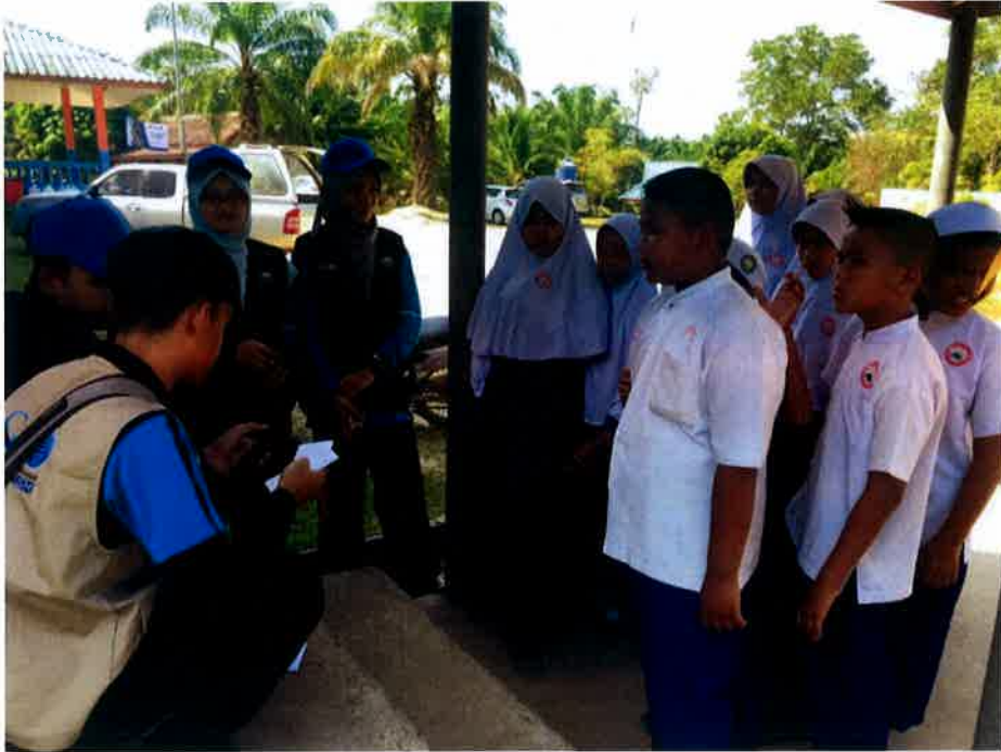
Chekpoint 4- Word Match Game iaitu aktiviti memadankan perkataan yang diberi samada sinonim atau antonim dengan betul.