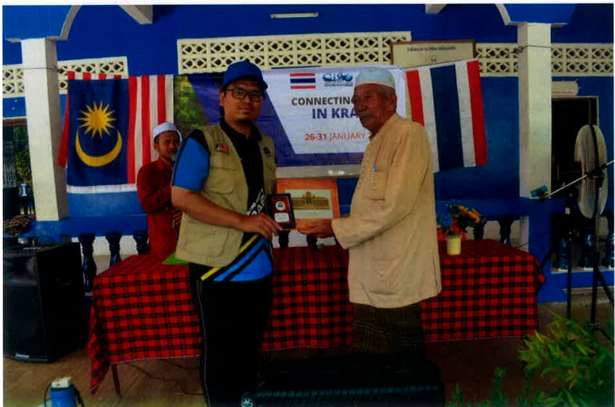
Penyampaian cenderahati berbentuk plaque sebagai tanda penghargaan daripada pihak giso.