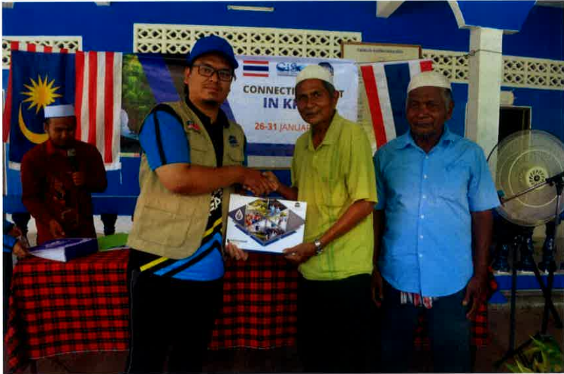
Penyampaian cenderahati daripada pihak Usim kepada penduduk kampung