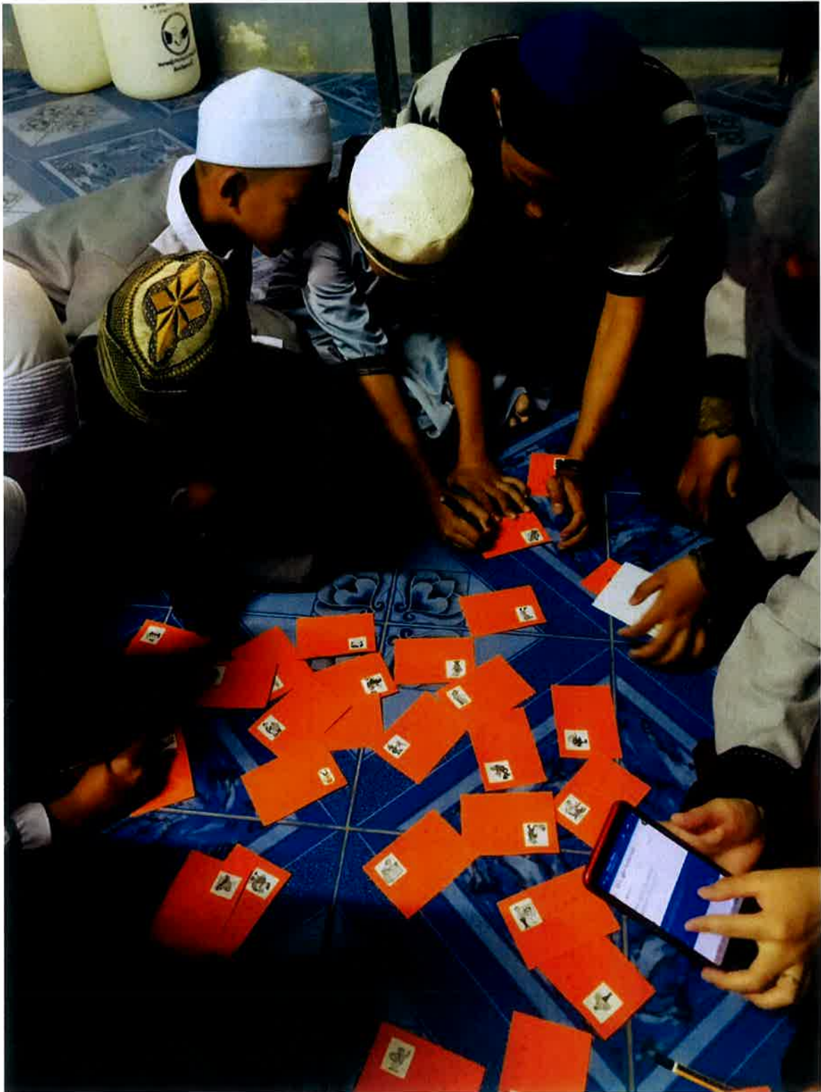
Pelajar perlu memilih sampul mengikut kategori yang disediakan oleh fasi, kemudian mereka harus menyusun perkataan dalam tiga bahasa iaitu bahasa Inggeris, Thailand dan Arab berdasarkan gambar.