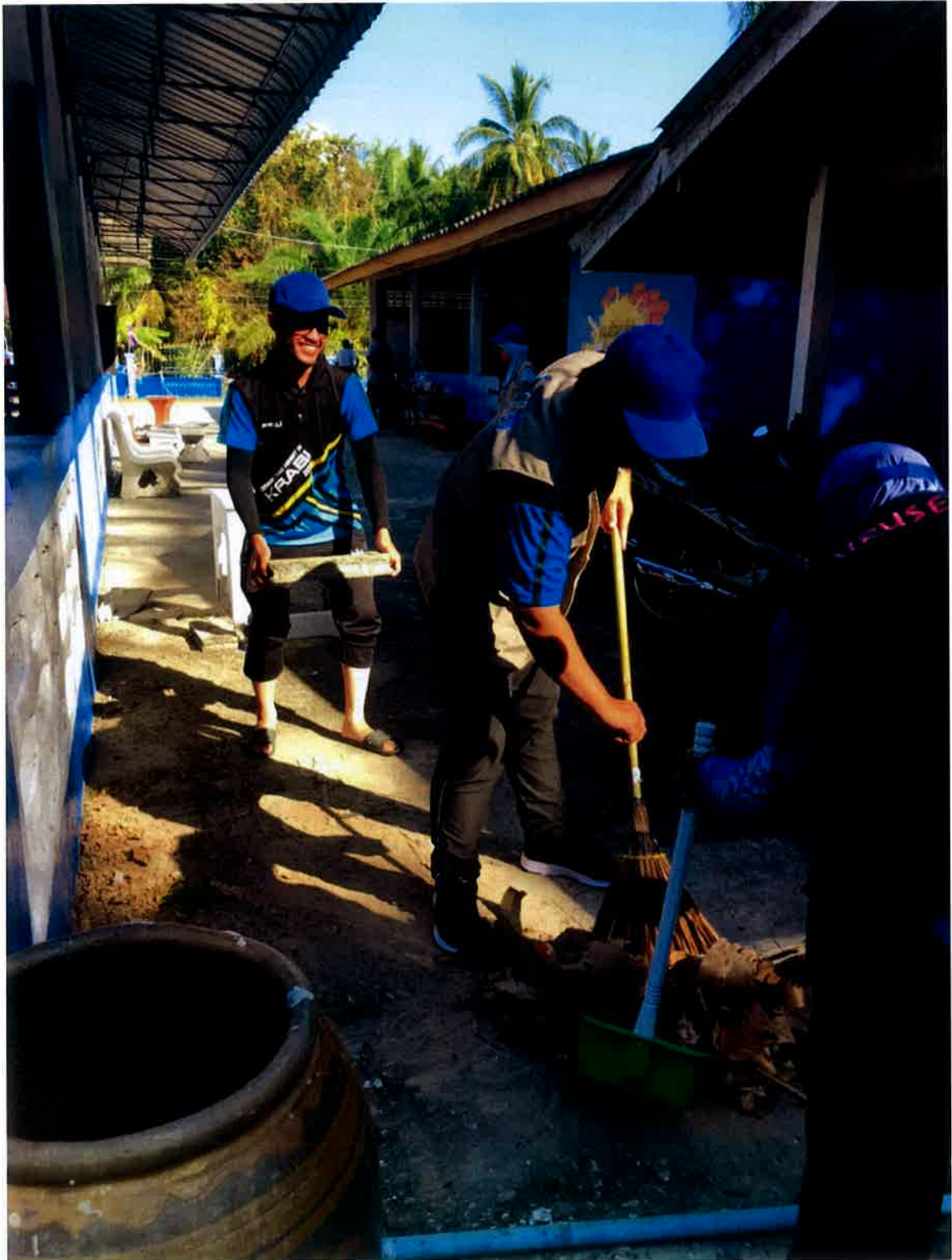
Aktiviti membersihkan persekitaran masjid.