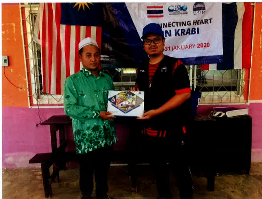
Penyampaian cenderahati kepada pihak sekolah.