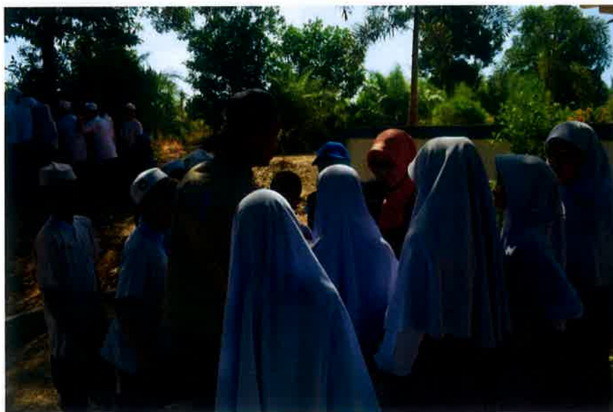
Checkpoint 1- Choral Reading iaitu aktiviti membaca teks dengan bernada secara berkumpulan, mengenalpasti dan mempelajari proses sebutan dengan tepat.