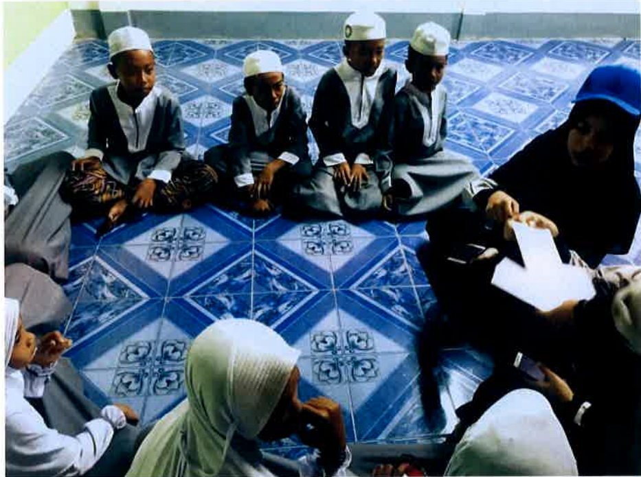
Sesi mengajar beberapa perkataan dalam Bahasa Inggeris sebelum memulakan permainan.