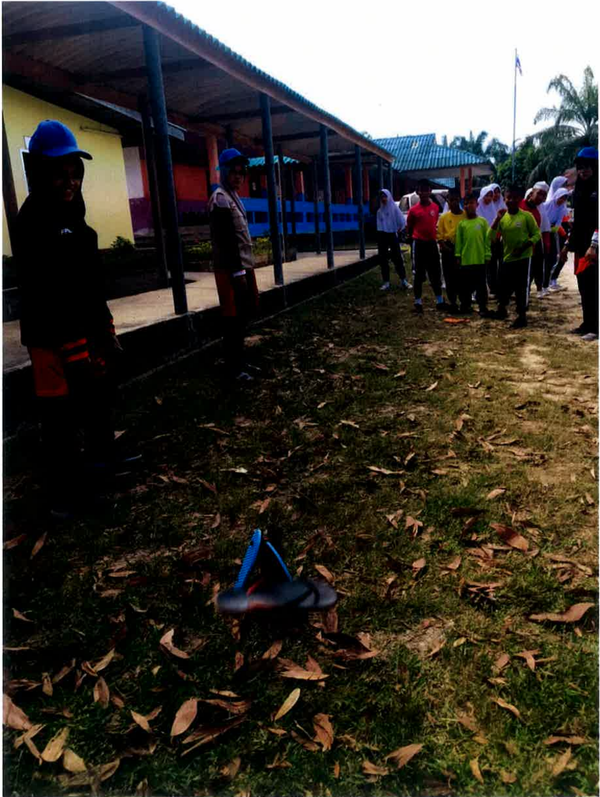
Aktiviti permainan tuju selipar oleh sekumpulan pelajar sekolah.